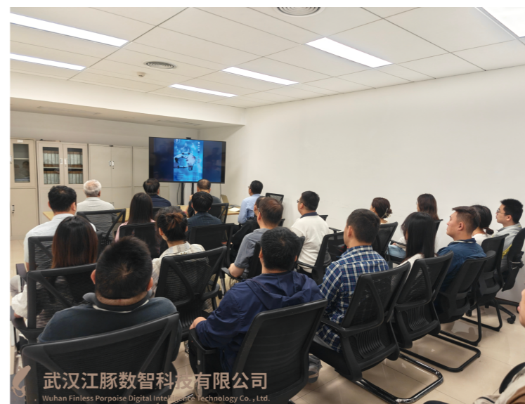
江豚数科“知识产权与人工智能”专项培训

4月26日，综合管理部质量控制组组织江豚数科全体员工开展“知识产权与人工智能”专项培训，通过视频学习、案例讨论等形式，讲解AI领域知识产权风险及合规解决方案，有效提升了全体员工的知识产权风险防控意识与实操能力。