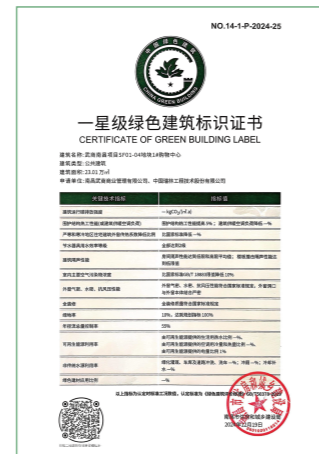
一星级绿色建筑标识证书

为进一步贯彻习近平生态文明思想，公司及旗下各所属企业积极开展节能降耗相关工作，通过节能改造、用能设施管理、培训宣传等方式，打造高效低碳的建筑本体，培育全体员工的生态意识、环境意识、节约意识，推动绿色生活创建活动走深走实。截至报告期末，南昌武商MALL获得“一星级绿色建筑标识证书”，全面贯彻绿色发展理念。