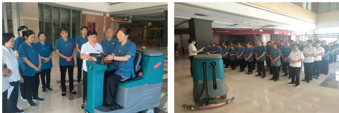
保洁人员应急专项培训

为筑牢环境管理应急处置能力根基，武商城市奥莱聚焦应急预案落地实效，面向保洁人员系统性开展专项培训46场，通过理论讲解、场景模拟、实操演练等多元形式，全方位强化保洁人员应急响应、协同配合与风险处置能力，推动应急预案从“纸上”落到“事上”，为环境安全筑牢坚实人才保障。