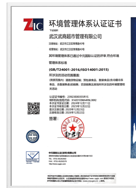
超市公司环境管理体系认证证书

武商集团严格遵守《中华人民共和国环境保护法》等法律法规，制定《物业管理服务标准》，并持续完善环境管理体系，由物业资产分公司统筹环境管理相关工作，系统化推动环境卫生维护与持续改善。截至报告期末，超市公司及江豚数科通过ISO14001环境管理体系认证。