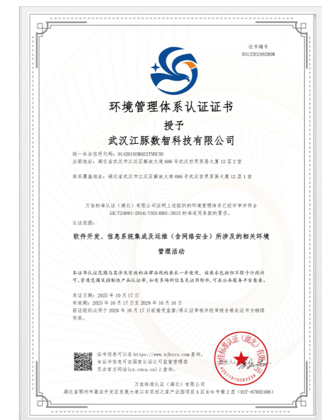
江豚数科环境管理体系认证证书