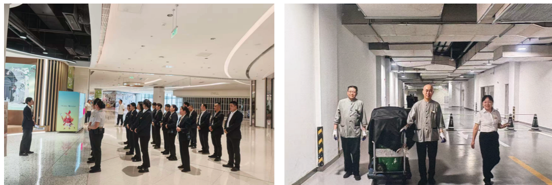
垃圾回收实操培训

培训聚焦商场场景痛点，详解可回收物、厨余垃圾，明确各楼层垃圾投放点位置及标识规范；实操环节模拟早中晚客流高峰，演示快速分拣、密封打包流程，强调餐饮区油污垃圾需双层包装防渗漏。同时培训清运路线规划，避开主通道及扶梯口，讲解清运车日常清洁与维护要点。培训后进行现场模拟考核，保障为顾客营造整洁有序的购物环境。